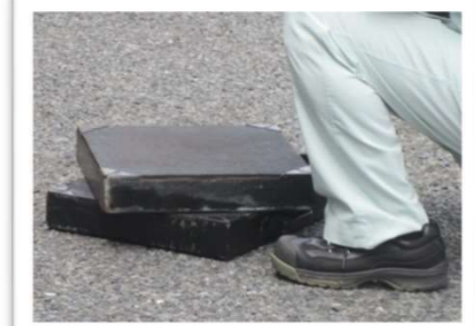
ジャッキベース二枚重ねの方法 (裏表有り、斜めに重ねる)